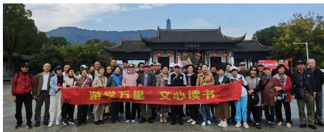
普陀区万里街道文心读书会开展人文行走读书活动

作为普陀区推动终身教育数字化、社区阅读品牌化的鲜活实践,“乐龄乐读 智享生活”项目以“AI+阅读”为创新内核,秉