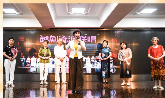
图为精神饱满的学员演唱情景

十年越韵流转,经典传承不息。5月20日下午,一场精彩的越剧专场在7楼多功能厅上演,学员们在唱腔韵味、表演技巧上的深厚功底尽显无遗。团队选角时反复斟酌,力求演员与角色完美契合;排练中精雕细琢,不放过任何