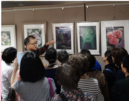
图为指导教师案例教学,现场评析作品特色

6月3日,一场别开生面的画展如约启幕。团队成员挣脱了年龄与风格的固有藩篱,大胆尝试,让颜料在画布上碰撞出绚烂的火花。画展期间,一场聚焦老年美术教育的研讨会热烈举行。团队成员与指导教师围坐一堂,各抒己见、畅所欲言。从实地写生采风敏锐捕捉自然的灵动之美,到创作交流时思维碰撞出璀璨的智慧火花;从技法切磋中不断提升专业造诣,到作品互评里收获真诚且宝贵的建议,成员们在团队的温暖怀抱中相互启迪、携手共进,共同迈向艺术的新天地。