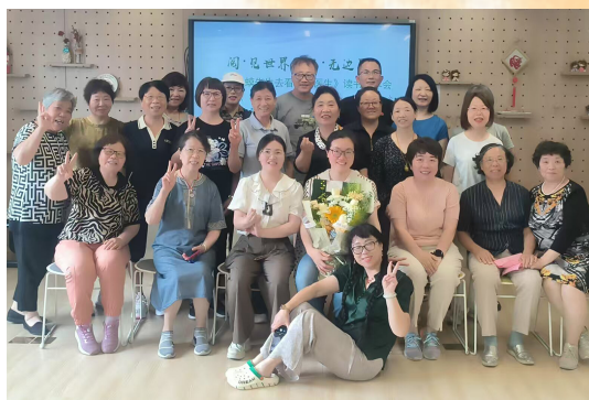
图为沉浸在温情世界里的师生们

编后语:此次展示交流活动是普陀区老年大学老年学习团队建设成果的集中检阅。在这里,人们看到的不仅是精湛的艺术技艺,更是团队成员间“老友相伴、携手同行”的深厚情谊;不仅是文化的传承与创新,更是老年群体通过团队协作