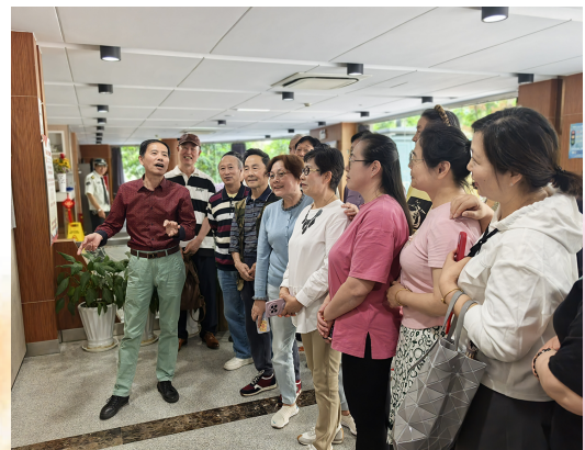
图为指导教师畅谈创作历程

5月12日,“江山如此多娇”主题画展开展。此次画展的创作团队以水墨丹青为载体,将自然之美与人生感悟熔铸于画卷之中。历时数月精心创作,一幅幅横幅长卷徐徐展开,层峦叠嶂间尽显山河壮丽,飞瀑流泉中蕴含灵动生机,令观者仿若置身其间,深切感受传统艺术的永恒魅力。团队成员以艺术为纽带携手共进,用画笔勾勒出对生活的热爱与追求,传递出积极向上的生命力量,彰显出“团队共绘山河”的磅礴气势。