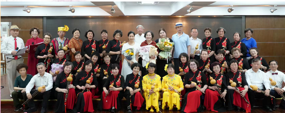
图为银铃葫芦丝团队集体亮相

6月20日下午,一场别具一格的葫芦丝专场演出徐徐展开。身着不同风格服饰的学员,手持葫芦丝,神情专注而投入,仿佛将全部身心都融入了这小小的乐器之中。他们凭借娴熟的技巧,把《月光下的凤尾竹》的温婉柔情、《一个美丽的地方》的清新明快演绎得淋漓尽致。从他们指尖缓缓流淌出的,不仅仅是美妙的旋律,更是对生活的无限热爱与从容不迫的态度。每一个音符都仿佛带着灵动的翅膀,在空气中翩翩起舞,传递着东方独有的雅韵与风情。