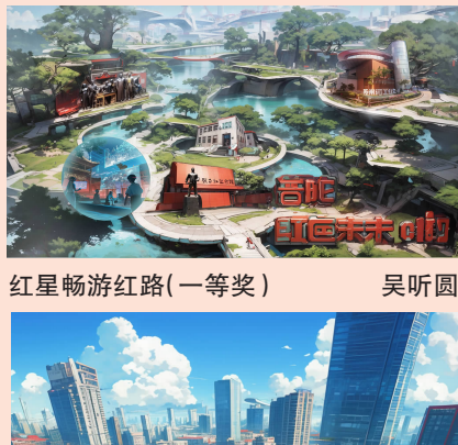
红星畅游红路(一等奖)