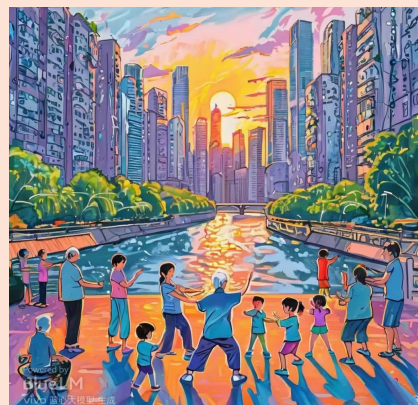
晨光悦苏河(一等奖)